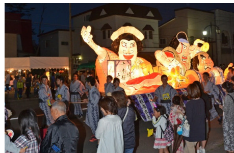
広尾高校あんどん行列（7月）